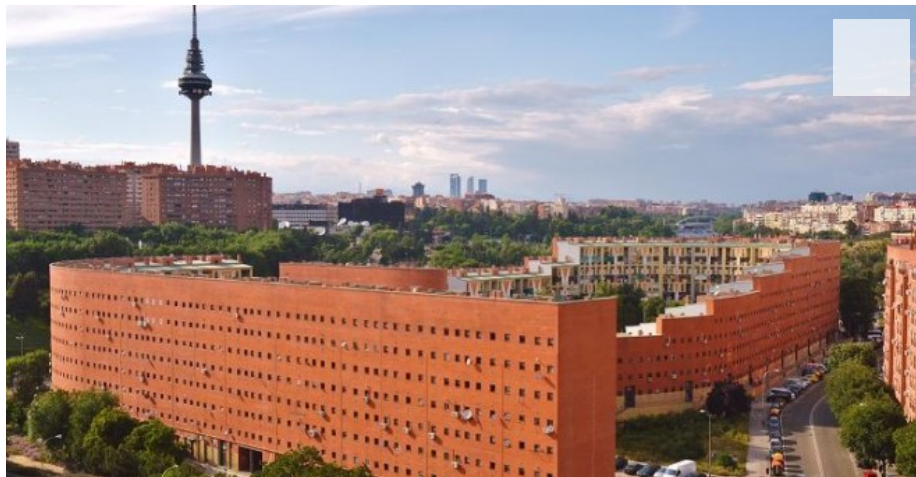
El Ruedo es uno de los edificios de realojo más grandes de España

El edificio levantado en el distrito madrileño de Moratalaz pelea desde hace años por dejar de ser un gueto.